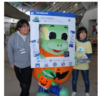
10/23の盛岡戦ではSNSパネルを使ったプロモーションを展開