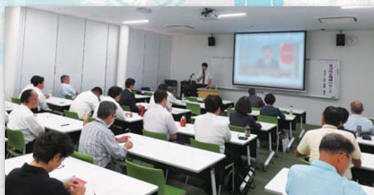
※昨年度の受講風景

◆ 開催場所: J:COM ホルトホール大分 大分市金池南1丁目5-1 第1回~第4回 2階 サテライトキャンパスおおいた講義室 第5回 4階 408講義室