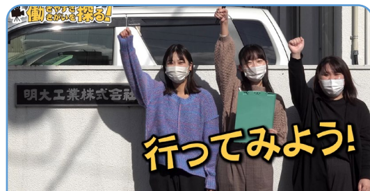
明大工業株式会社様