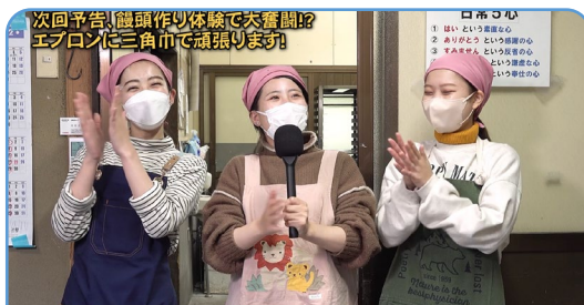
農事組合法人 グリーン法人中野様