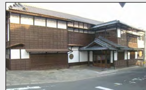
写真：竹田市公民館竹田分館 旧一味楼