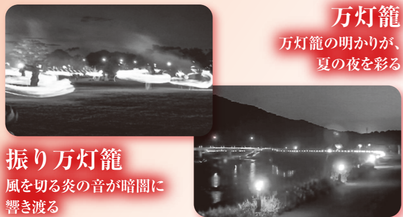
振り万灯笼 風を切る炎の音が暗闇に 響き渡る