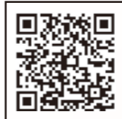
大分市ホームページ

柱松へ火の点いた松明を投げ上げ、五穀豊穡と疫病の退散を願う七瀬の「柱松行事」。子ども柱松を含め、10本以上の柱松による壮大な火の競演をお楽しみください。