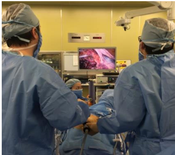
小さな手術創で手術を行う外映像