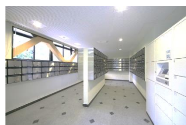
メール・宅配ボックス