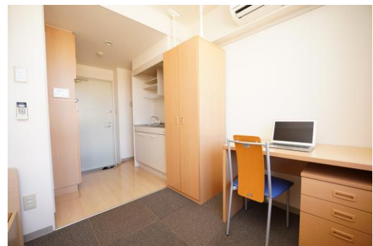
（ノートPCは備品ではありません）