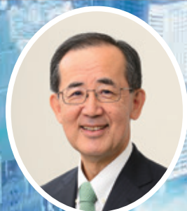
前日本銀行総裁 白川 方明氏