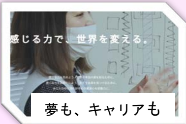
感じる力で、世界を変える。

ソニーは、スマホや車などに使う画像センサーの世界シェア1位です。これからの AI, DX 時代に必須の「半導体の製造現場」で活躍する女性と話しましょう。みなさんのご参加をお待ちしております。